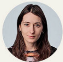
Автор проекта: дизайнер Дарья Смирнова (дизайн-студия «ДариОл»), г. Владимир

«Наша задача состояла в том, чтобы заказчики чувствовали себя счастливыми в новом интерьере»